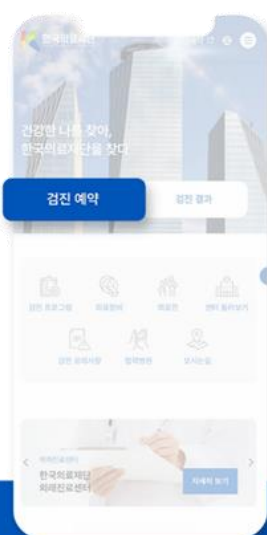
STEP 01 검진 예약 클릭