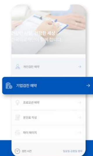
STEP 02 기업검진 예약 클릭