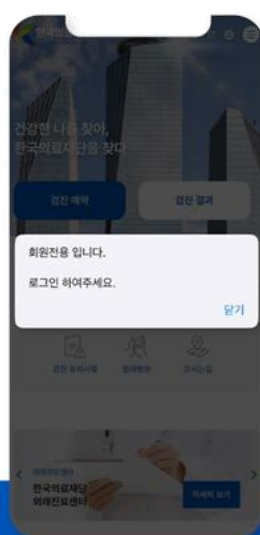
STEP 03 로그인 하기